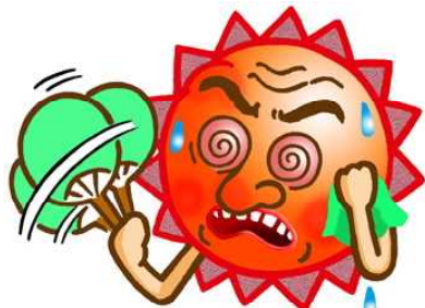
あついぞ！熊谷