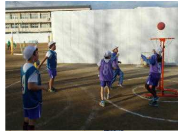
《ポートボールの様子》