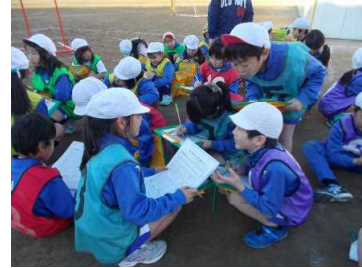
体育授業でも《学びあい》