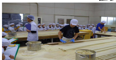
五家宝工場(紅葉屋)