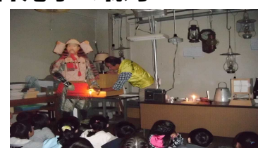
昔の道具(嵐山史跡の博物館)