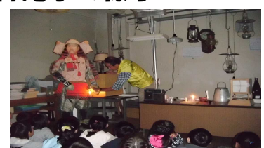
昔の道具(嵐山史跡の博物館)