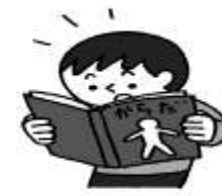
怪について学びたいとき