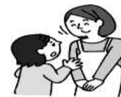
悩みや心配があるとき